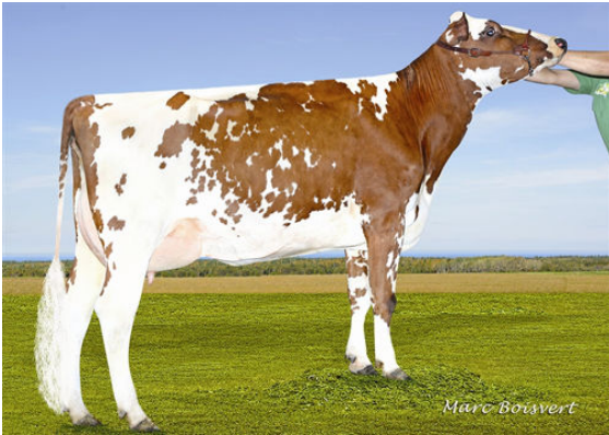
DU BOIS BRULE DECAF KATY