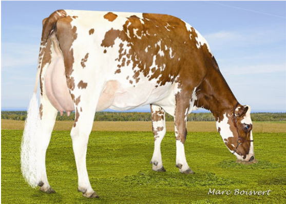
DU BOIS BRULE DECAF KATY